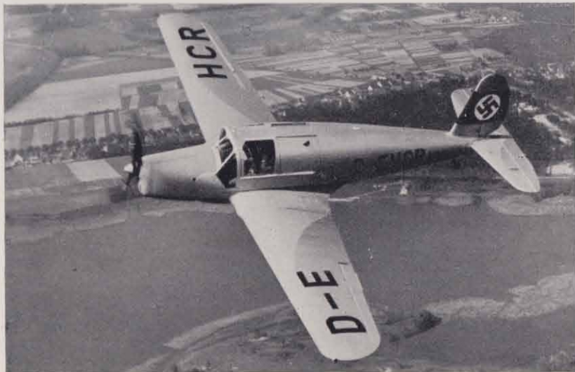
Arado Ar 79, Kabinenflugzeug für Reise und Schulung.