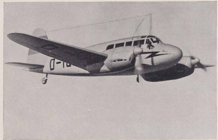
Siebel Fh 104, zweimotoriges Schnellreiseflugzeug für 5 Personen.