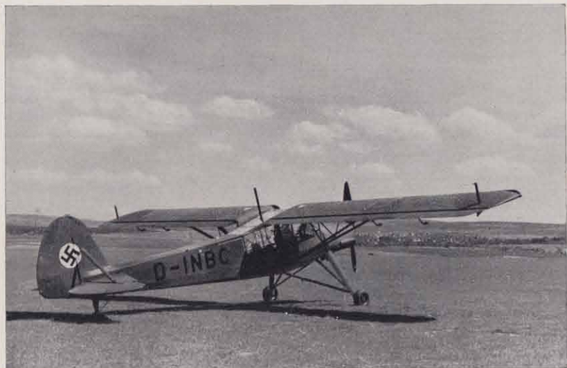
Fieseler Fi 156, „Storch“, Reiseflugzeug.