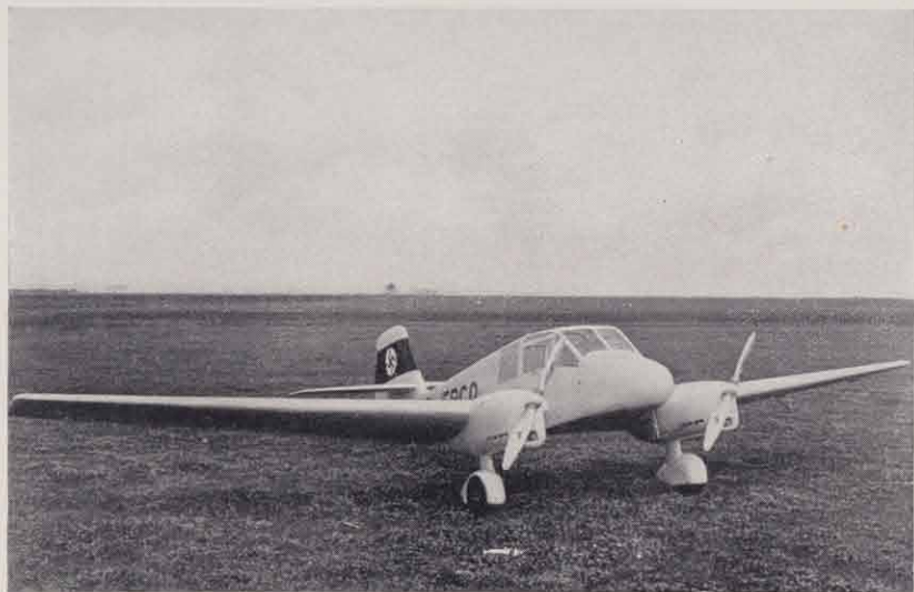
Gotha Go 150, zweimotoriges Kabinen-Kleinflugzeug.