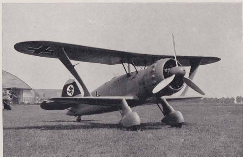
Henschel Hs 123, einsitziges Sturzkampfflugzeug.