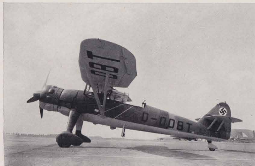
Henschel Hs 126, zweisitziges Mehrzweckflugzeug.