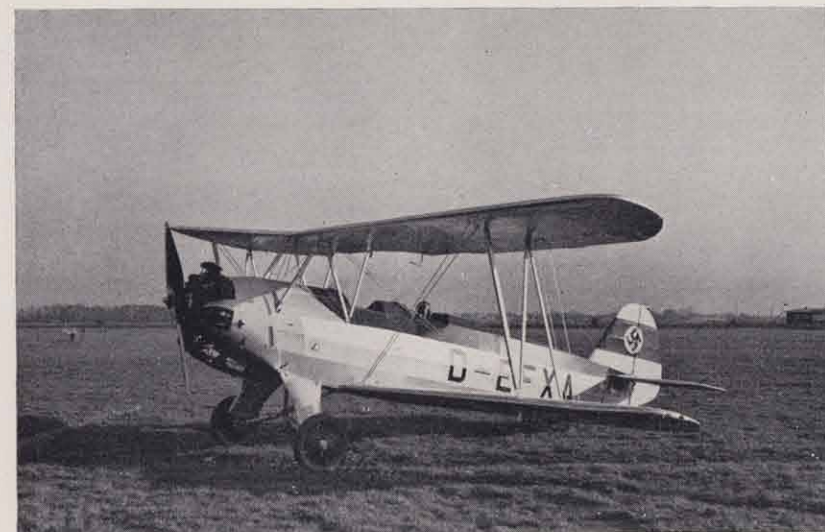
Focke-Wulf Fw 44, „Stieglitz“, für Kunstflug, Schulung, Reise und Sport.