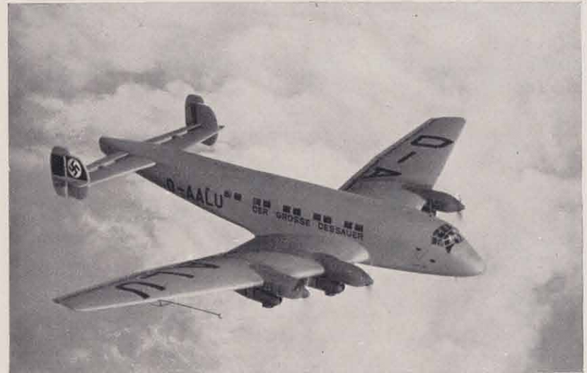
Junkers Ju 90, Verkehrs- und Frachtflugzeug.