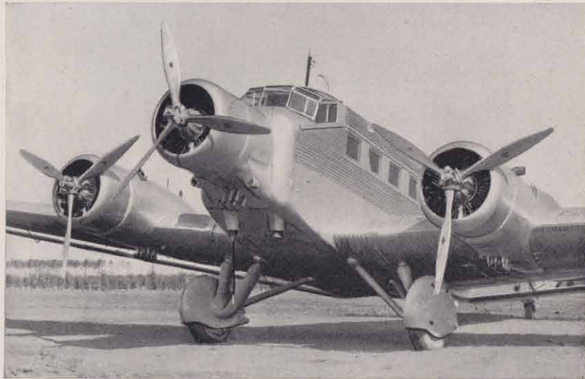
Junkers Ju 52/3 m, Verkehrsflugzeug.