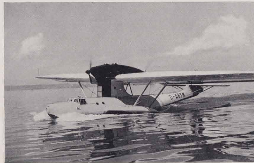
Dornier Do 18, Langstreckenflugboot.