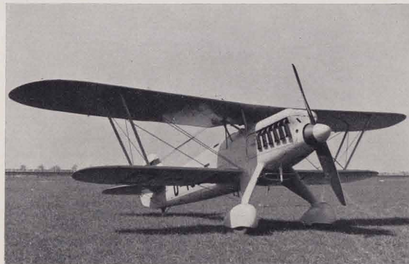
Heinkel He 51 L, Jagdeinsitzer.